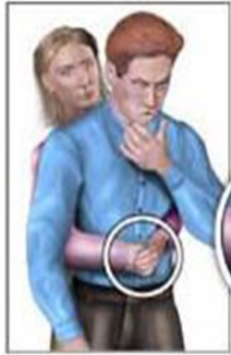
Maniobra de Heimlich en Adulto

Los niños deberán acudir al colegio con ropa y calzado cómodos, preferiblemente chándal y deportivos.