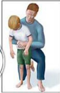
Maniobra de Heimlich en Niños